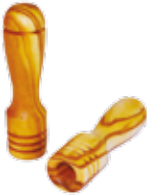
Presine in legno d'olivo