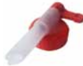
Erogatore di bioetanolo