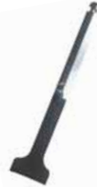
Regolatore di fiamma